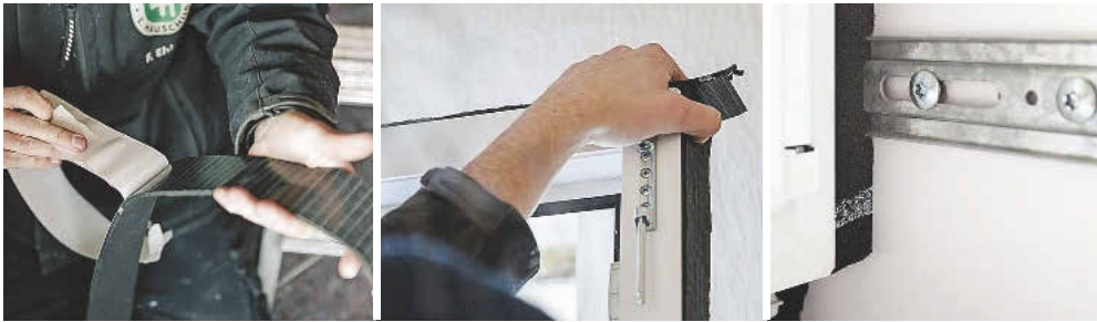
Fenstermontage mit dem Dichtband »3Complete Renova« von Pinta