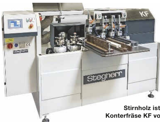
Stirnholz ist ihr Metier: Konterfräse KF von Stegherr

herrscht die Maschine ebenfalls. Sie ist in verschiedenen Ausbaustufen lieferbar: mit Motorvarianten von 4 bis 7,5 kW, verschiedenen Spindellängen und Werkzeugaufnahmen; mit zwei oder vier Hubspindeln, pneumatisch oder mit Servoantrieb, mit Werkzeugwechsler, mit einfacher Ablängsäge, mit Zugsäge oder NC-gesteuerter Säge. Die Maschine erkennt Teile per Barcode-Scanner und wird über Symbole auf einem Touchscreen intuitiv bedient.